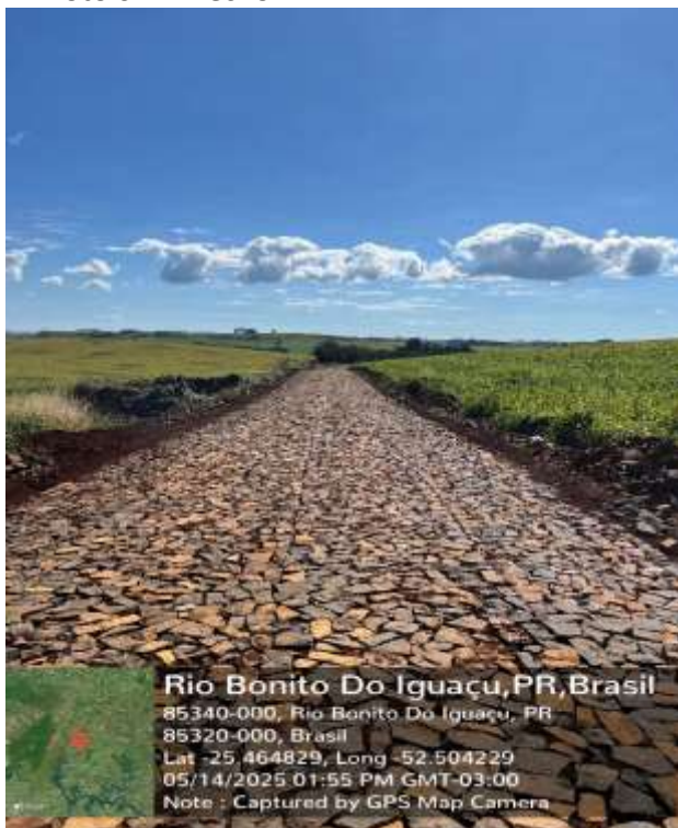
Foto 05 - Trecho