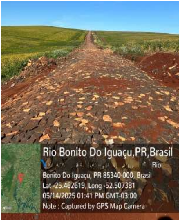
Foto 03 - Trecho