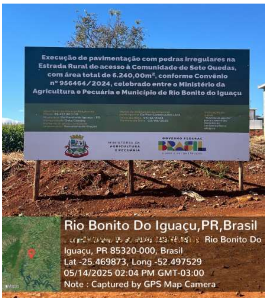
Foto 01 Placa da Obra