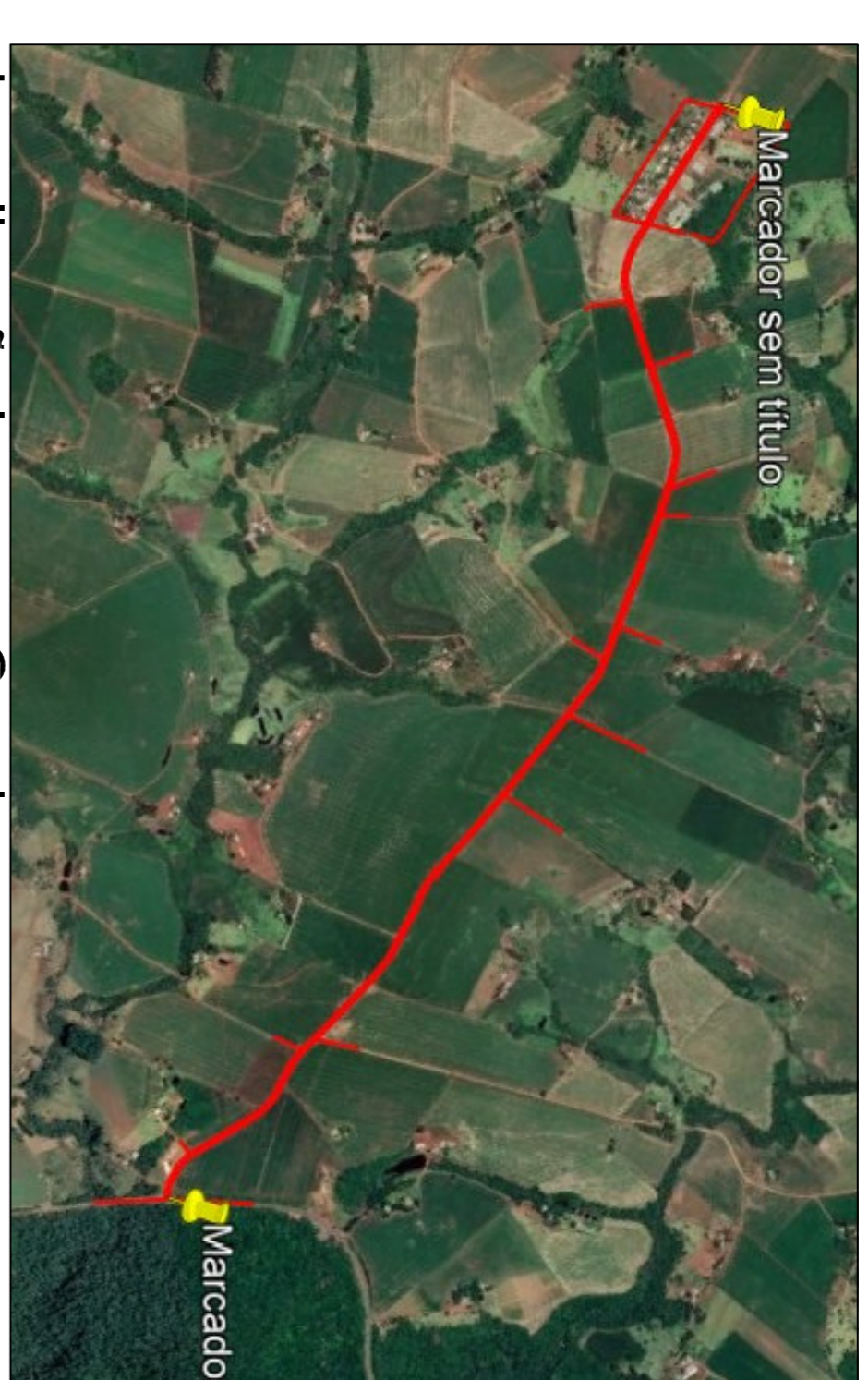
Localização Imagem Google SEM ESCALA