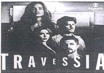
QUINTA-FEIRA - 26 DE JANEIRO

Ben fica impaciente ao saber que o cliente de Lumiar, pai de Guiga, foi preso no aeroporto com muito dinheiro. Fred vê Kate tirando foto de Guiga e a repreende com grosseria. Lumiar e Ben chegam ao aeroporto. Jenifer e Otávio se beijam no carro. Lumiar e Ben explicam para Guiga o que houve com seu pai. Erika critica Anthony por se gabar de uma notícia que não fez sucesso algum. Sol reclama de ter que fazer um clipe com Lui, e Vitinho a repreende. Ivy conta para Wilma que foi ela quem divulgou a foto de Sol e Lui no momento do acidente na piscina. Sol e Lui gravam o clipe. Carlão é assaltado.