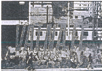
QUINTA-FEIRA - 26 DE JANEIRO

Vespertino e Floro comemoram a entrada do dinheiro para a construção do hospital, mas escondem de Candoca. O sheik Omar chega à Cantá Pedra e pede sigilo a Quintilha. Xaviera está atormentada com suas dívidas sobre o caráter de Tertulinho. O Coronel conta a José e Candoca que foi interditado por Tertulinho. Deodora afirma a Pajéu que tomará tudo do Coronel. Firmino confessa seu amor por Lorena, que diz que é apenas sua amiga. O sheik Omar agradece Timbó e Tereza por terem salvado a vida de Maruan. Omar se apresenta para Maruan. José questiona Fubá Mimoso/Dom Tião sobre o mandante de seu assassinato.