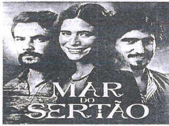
QUINTA-FEIRA - 26 DE JANEIRO

Vespertino e Floro comemoram a entrada do dinheiro para a construção do hospital, mas escondem de Candoca. O sheik Omar chega à Cantá Pedra e pede sigilo a Quintilha. Xaviera está atormentada com suas dívidas sobre o caráter de Tertulinho. O Coronel conta a José e Candoca que foi interditado por Tertulinho. Deodora afirma a Pajéu que tomará tudo do Coronel. Firmino confessa seu amor por Lorena, que diz que é apenas sua amiga. O sheik Omar agradece Timbó e Tereza por terem salvado a vida de Maruan. Omar se apresenta para Maruan. José questiona Fubá Mimoso/Dom Tião sobre o mandante de seu assassinato.